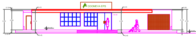
FACHADA SUR ESCALA 1:75